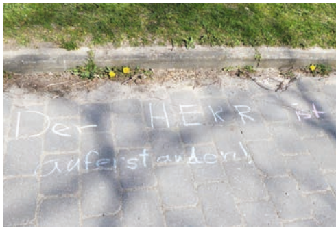
Der Herr ist auferstanden!

Besonders gefreut habe ich mich, dass meine Eltern und ich am Ostersonntag in der Kapelle in Grambek eine Andacht feiern durften.