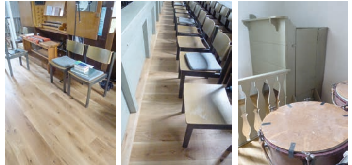
Neuer Emporenfußboden und „Blasebalgsitzplatz“

Sein wunderschönes und kunstvolles Orgelspiel wird den vom Kirchengemeinderat getätigten Aufwand entlohnen.