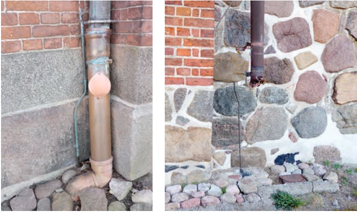
▲ Zum Vergleich: Kupferner Einlaufstutzen an der Nikolai-kirche in Kappeln mit unkonventionellem Plastikdeckel als Ersatz für gestohlenen Revisionsdeckel.

Die gepflasterten Wege auf dem Friedhof wurden von der Firma Prieß aus Mölln überarbeitet, sodass etwaige Stolperfallen beseitigt sein müssen.