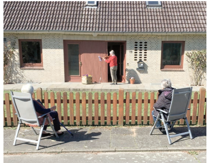
J. M. vor der Haustür

oder durch Geigenspiel der Osterlieder vor der Haustür Am Alten See.