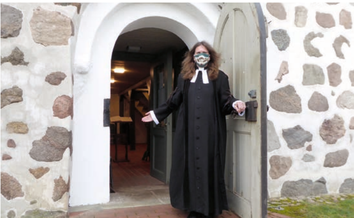
Pastorin Böckers in Corona-Zeit

Der Kirchengemeinderat geht davon aus, dass sich alle Bürgerinnen und Bürger nicht durch diese Beschränkungen von der Teilnahme am Gottesdienst abhalten lassen werden. Die Gemeinschaft der Gläubigen in unseren Gotteshäusern ist ein Lebenselixier.