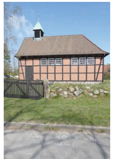
St. Annen-Kapelle in Grambek

Ich war deshalb auch sehr traurig, als Mama mir sagte, dass wir Ostern nicht wie sonst mit meiner Oma, meinem Opa, meiner Tante, meinen Onkeln und meiner Cousine feiern können. Wir haben uns gegenseitig Postkarten und Geschenke geschickt - und telefoniert. Aber das ist ja nicht das gleiche wie ein schönes Osterfest mit der Familie.